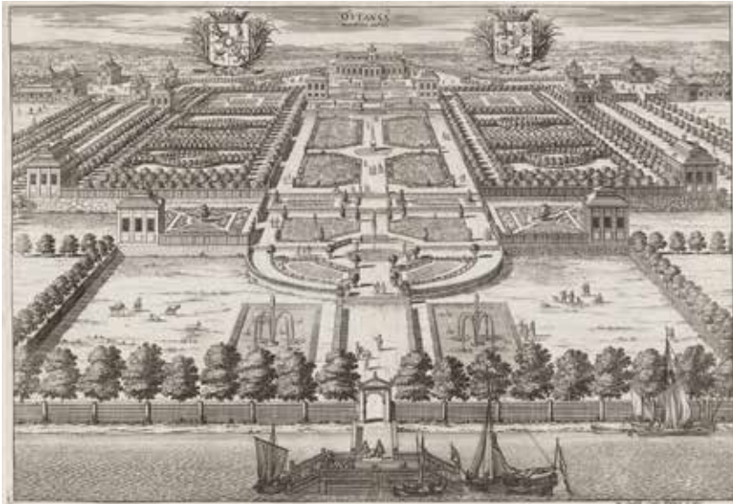
Erik Dahlberghs teckning av Östanå i Suecia Antiqua et Hodierna .

trädgården brändes ner i samband med de ryska härjningarna 1719. Först 1791 byggdes en ny herrgård i sten på samma plats.