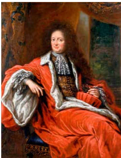
Porträtt av Fabian Wrede målat 1690 av David Klöcker Ehrenstrahl.