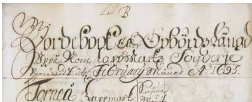
Jordebok, eller uppborädsbok öfver Norra lappmarken, från 1695. Detalj från sidhuvud.

jordnatur (skatte, frälse eller krono). För att vara en formell jordebok skulle dessutom de enskilda landen ha besökts på plats och inspekterats. Trots dessa brister accepterade Kammarkollegiet den som en jordebok och den kallas i de inledande texterna både för jordebok och uppborädsbort. 28