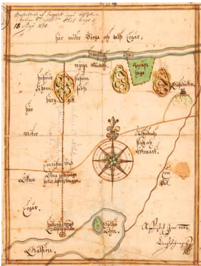
Karta från 1662 av lantmätare Lars Johansson.

Anderssons uppgifter att landskapsgränsen tidigare gått betydligt längre österut genom Kamhaf och Gäddbäcken till Arbogaån .