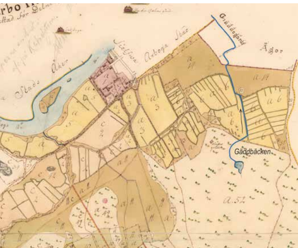
Karta 1733 (beskuren) över Porsgården med Gäddbäcken (blåmarkerad) vidare genom den lilla sjön *Kambohaf. Fyrkanten markerad som »klåstergrund« är Helge Svens kapell.

Även Grindberga redovisas åren 1569 och 1571 i tiondelängderna över Arboga socken. 25 Både Grindberga och Älholmen tillhörde alltså tidigare Götlunda socken i Närke.